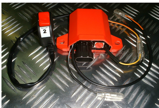
Figuur 1 (digitale CDI unit)